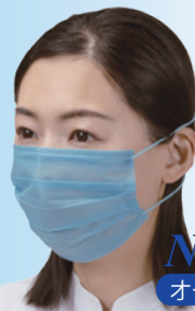
No.2834 オーバーヘッドタイプ