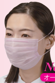
No.2836 オーバーヘッドタイプ