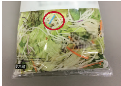
※混入対策マスク(ブルー)のノーズクリップ混入時