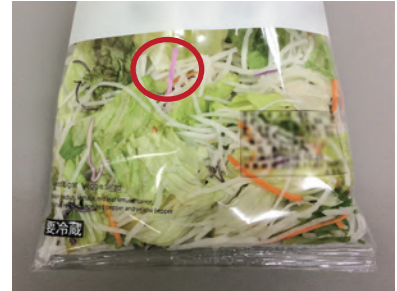
※混入対策マスク(ピンク)のノーズクリップ混入時