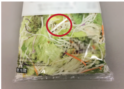
※白色マスクのノーズクリップ混入時